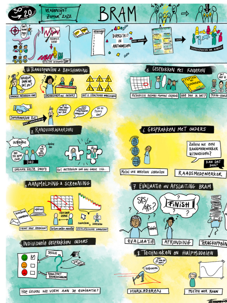
Praatplaat door Fransje Immink (2022) Klik op de afbeelding voor de digitale versie