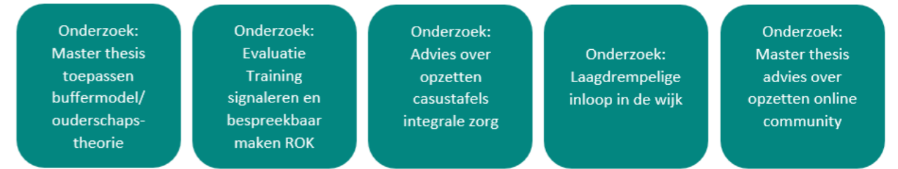
Figuur 1: Onderzoeksactiviteiten