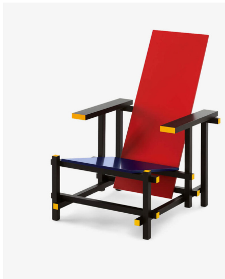
Gerrit Rietveld: Rood-blauwe stoel 1923 Geverfd hout 66 x 87 x 83 cm Collectie Stedelijk Museum Amsterdam

Is 'De Schreeuw' van Munch juist mooi en indrukwekkend door de kwaliteit van de schilderkunst? Of wekt de angst van de rare figuur op de voorgrond juist afkeer?